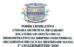
Tabela 1 - Demonstrativo da Despesa com Pessoal - Estados, DF, Municípios RGF - ANEXO I (LRF, art. 55, inciso I, alínea "a")