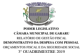
Tabela 1 - Demonstrativo da Despesa com Pessoal - Estados, DF, Municípios RGF - ANEXO I (LRF, art. 55, inciso I, alínea "a")